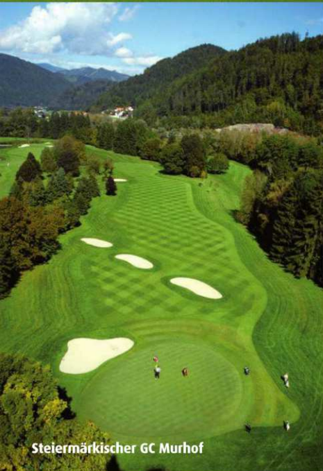
Steiermärkischer GC Murhof