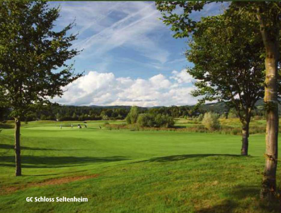
GC Schloss Seltenheim