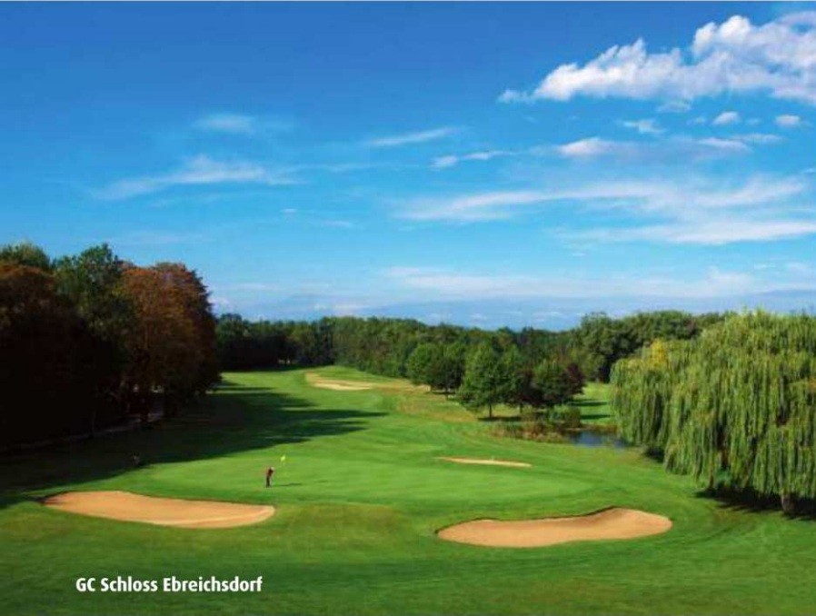
GC Schloss Ebreichsdorf