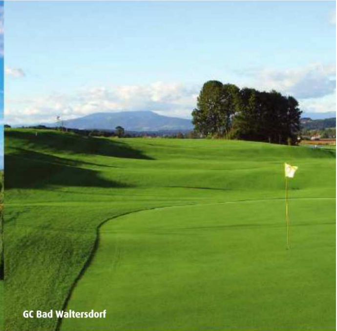
GC Bad Waltersdorf