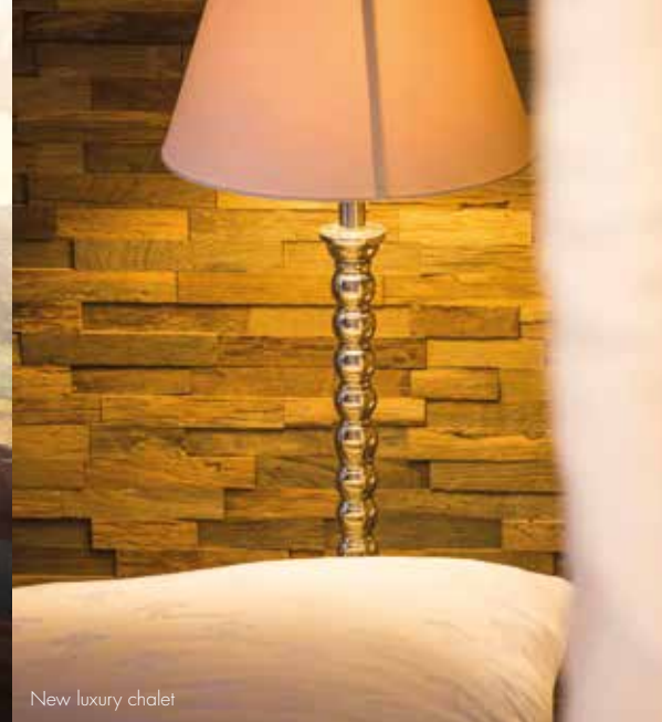
New luxury chalet