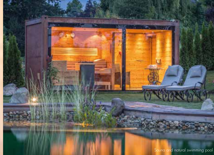
Sauna and natural swimming pool