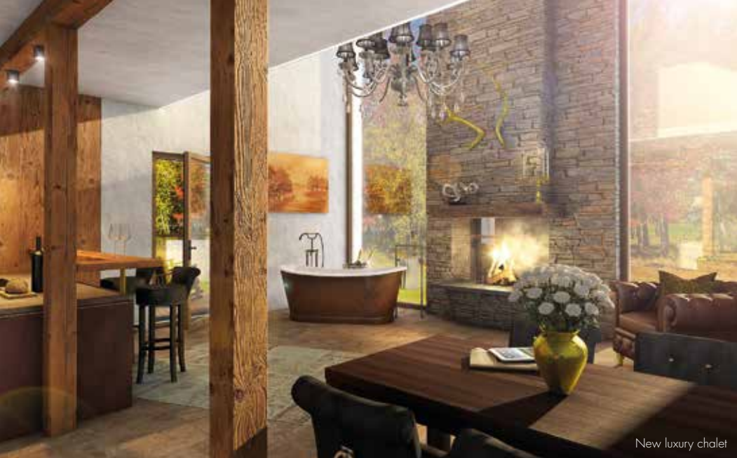
New luxury chalet