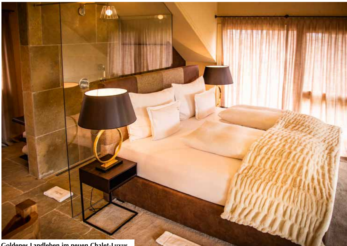
Goldenes Landleben im neuen Chalet-Luxus.