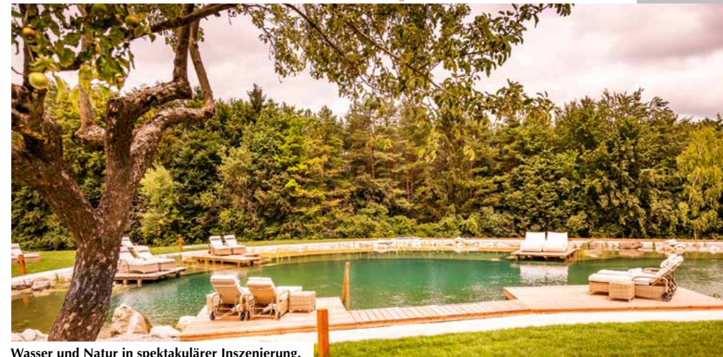
Wasser und Natur in spektakulärer Inszenierung.