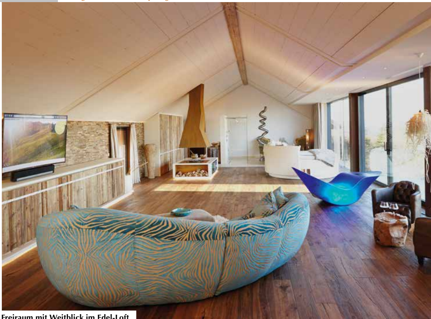
Freiraum mit Weitblick im Edel-Loft.