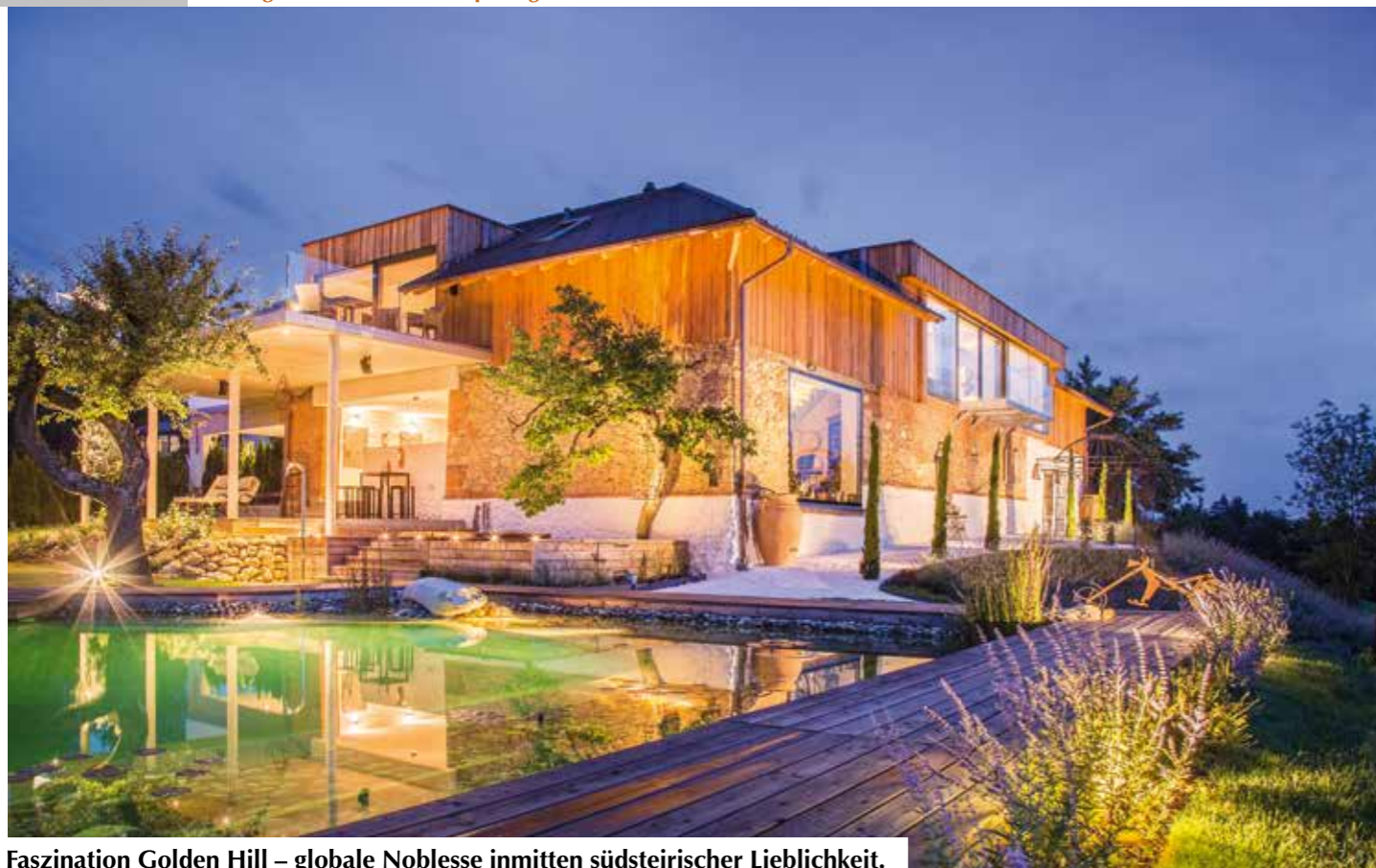
Faszination Golden Hill – globale Noblesse inmitten südsteirischer Lieblichkeit.