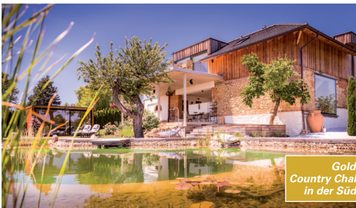
Golden Hill Country Chalets und Suites in der Süd-Steiermark