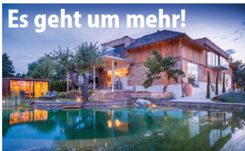
Das Golden Hill Loft mit eigenem Infinity-Naturschwimmteich