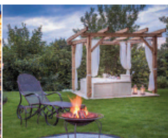
Exklusiv – eigener Spa Bereich beim Landhaus