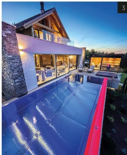
(3) Der ganzjährig beheizte INFINITY-POOL – ein weiteres Puzzleteil für eine unvergessliche Sinneserfahrung.

Privatissimum pur erwartet Gäste auch im Vollholz-Galeriehaus Polarfuchs, das seine Gäste mit „polariger“ Extravaganz empfängt. Dafür sorgen das ausgesuchte Interieur – alles in Weiß – und die schimmernde, vor dem Kamin stehende Devon & Devon-Badewanne. Nicht zuletzt dann noch der eigene Spa-Garten mit extra großem Sauna-Kubus sowie der glasklare 600 m 2 Naturschwimmteich.