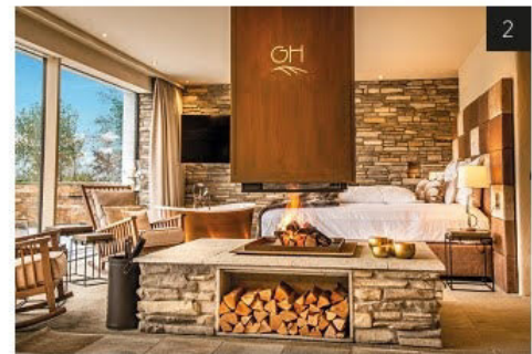
(1) Das neue CHALET POLARFUCHS begeistert unter anderem mit seiner „polarigen“ Extravaganz. (2) Luxus pur im neuen CHALET STEPPENFUCHS mit dem mächtigen Kamin als charmanter Blickfang.

Das stolze Mitglied der Hideaways Hotels Collection ist bereits vielfach prämiert, dieses Jahr gleich zwei mal. Erster Platz bei den „Lieblings Chalets 2021“ in der Kategorie Ausstattung von MEIN TOP HOTEL und mit dem renommierten Gault&Millau-Award als „Bestes Chalet 2021“. Zurecht.