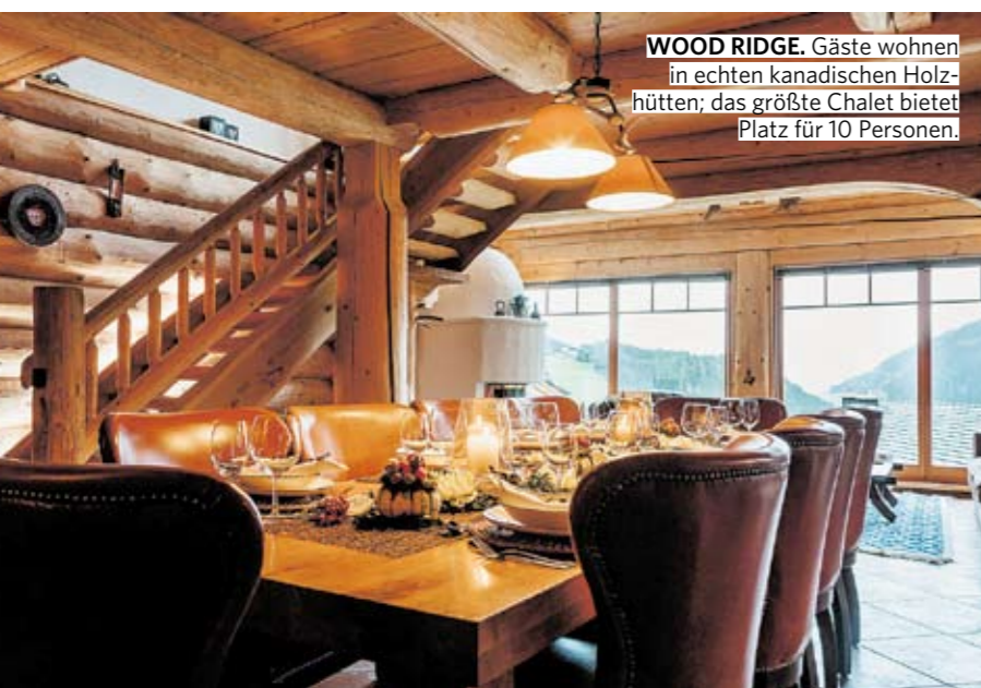
WOOD RIDGE. Gäste wohnen in echten kanadischen Holzhütten; das größte Chalet bietet Platz für 10 Personen.

down eine Möglichkeit gesucht, wie wir unseren Familienurlaub verbringen können, ohne viel mit anderen Menschen in Kontakt zu kommen. So sind wir ursprünglich auf die Alps Resorts gestoßen“, verrät sie. „Mittlerweile lieben wir aber die Möglichkeit, tun und lassen zu können, was wir möchten. Wir müssen uns morgens nicht an Frühstückszeiten halten und können auch einfach im Pyjama gemeinsam essen. Es ist stressfrei, und während die anderen noch auf dem Weg in die Wanderdestination sind, sind wir schon längst da!“ Sich selbst zu versorgen, stört sie nicht: „Wir haben im Alltag ohnehin kaum Gelegenheit, miteinander zu kochen. Also machen wir das im Urlaub. Unsere Kinder sind jetzt 6 und 8 Jahre alt, die helfen gern mit. Und wenn es einmal etwas wilder zugeht, stört das auch niemanden.“