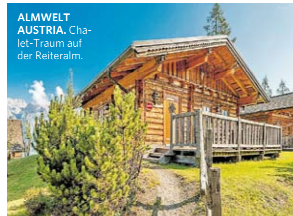
ALMWELT AUSTRIA. Chalet-Traum auf der Reiteralm.

Chalet-Urlaub punktet mit der Freiheit, tun und lassen zu können, was man möchte. Den Rhythmus für die Auszeit gibt man selbst vor.