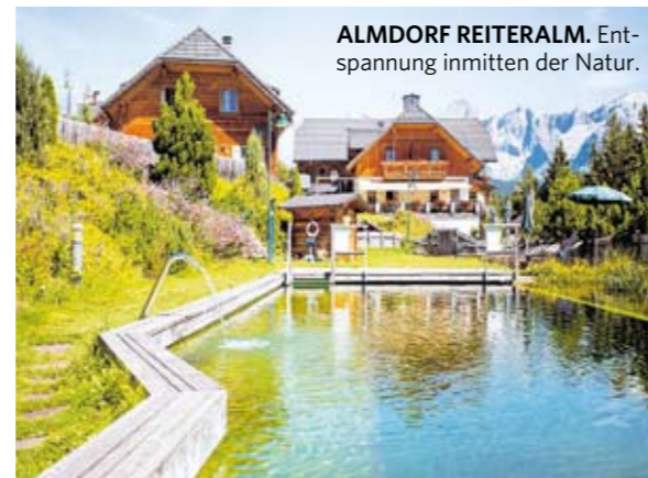
ALMDORF REITERALM. Entspannung inmitten der Natur. Wohnen mit Berg-Blick.