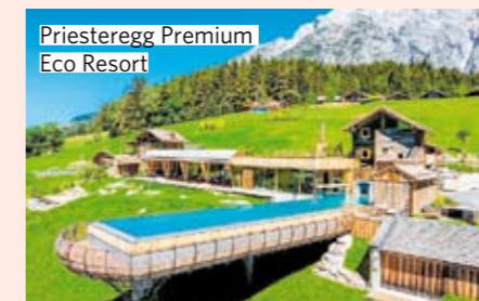
Priesteregg Premium Eco Resort

➔ Natur-Juwel Alte Schmiede. 2021 entstand aus dem unpräzisen Holzbau im Mostviertel ein zauberhaftes Chalet. Ab 18 Euro/Nacht und Person, mind. 3 Nächte,