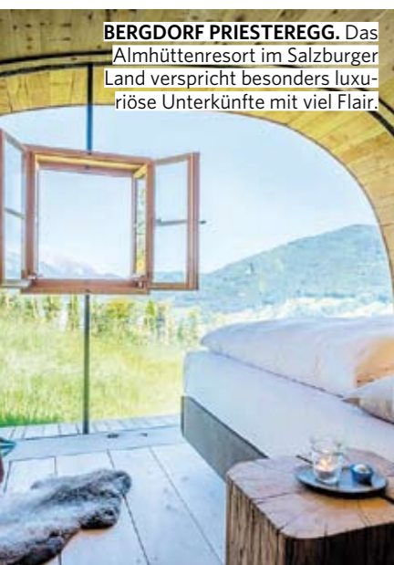
BERGDORF PRIESTEREGG. Das Almhüttenresort im Salzburger Land verspricht besonders luxuriöse Unterkünfte mit viel Flair.