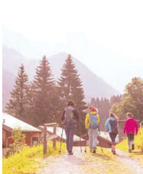
EINFACH RAUS. Die Natur am Hauser Kaibling lädt zum Entdecken ein.