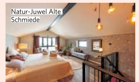
inkl. Frühstück. natur-juwel.at

➔ MONTE STYRIA. Wunderschöne Chalets mit Weitblick am Fuß der Bürgeralpe in Mariazell/Steiermark. Eigene Wellnessbereiche mit Sauna und Bädern. Chalet für bis zu 4 Personen erhältlich ab 480 Euro/Nacht. montestyria.at