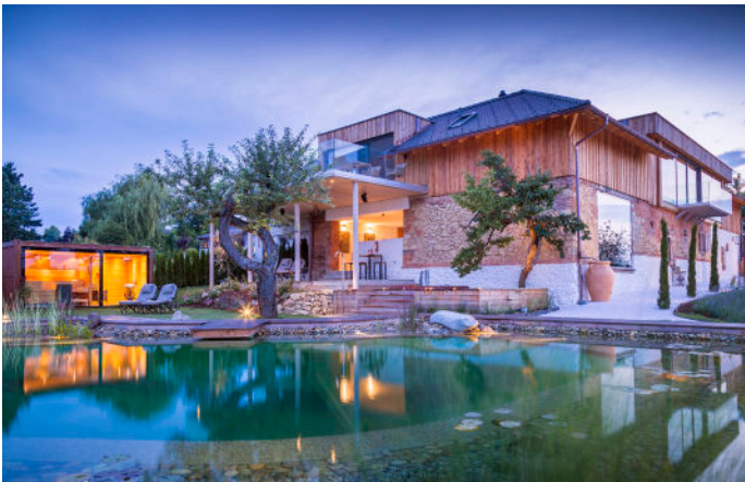
Exklusive Erlebnisarchitektur in der Symbiose mit ästhetischer Natürlichkeit: Das ist das Paradies namens Golden Hill.