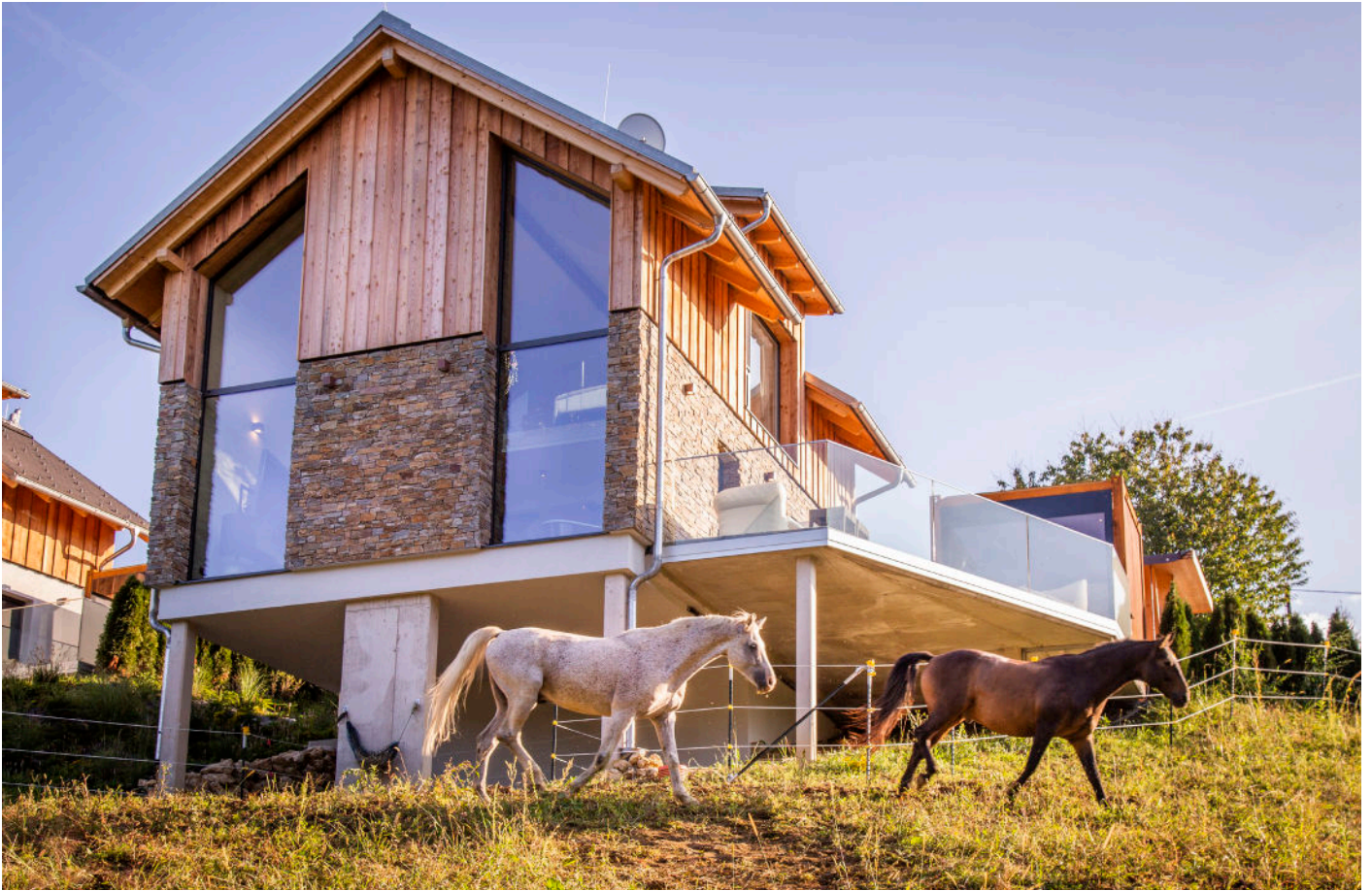
Beim Chalet Goldfuchs können Sie Ihre Pferde in der Koppel direkt vor Ihrer Terrasse grasen lassen – ideal für Reitbegeisterte.