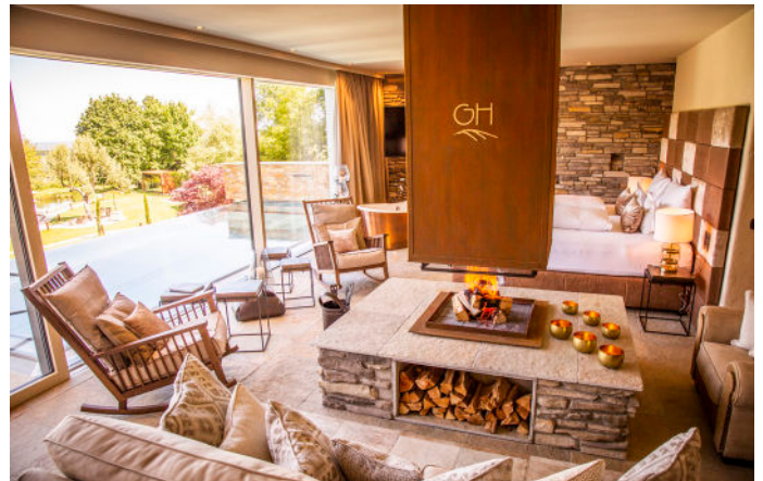
Vom puren Luxus kosten, indem man bei knisterndem Kaminfeuer entspannt in den Tag hineinlebt.

knisternden Stunden am Kamin gönnt man sich Massagegenüsse im Private-Spa des eigenen Chalets. Fernab von Alpenchique und üblichen Chalet-Normen strahlt das elegante Ensemble in die endlich wieder länger werdenden Tage hinein. Das zentrale Highlight: Der 600 Quadratmeter große Naturschwimmteich und die großzügige Parkanlage mit Panoramablick, Champagner-Lounge und Feuerstellen. Ein weiterer größerer Sauna- und ein einzigartiger Fitnesskubus stehen dort ebenfalls zur freien Verfügung.